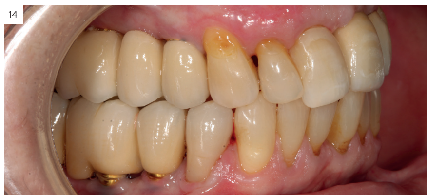
Figuras 13 y 14. Imágenes de la paciente a los tres años de la confección de la prótesis.