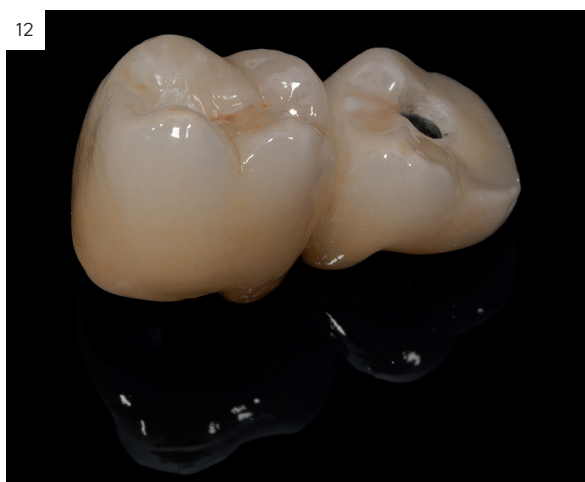
Figuras 11 y 12. Prótesis terminada con los contornos gingivales acabados en composite.

5. Una vez cementada la cerámica al metal se procede al acabado de la zona gingival de la restauración. Este paso trata de que no se genere contacto del metal con el área gingival. Para ello se realiza un chorreado del metal con Al_2O_3 de 90 \mu para el metal y un grabado ácido para la cerámica correspondiente a este área. Después se aplica un primer para metales: Solidex Metal photo primer (Shofu dental GmbH, Ratingen, Alemania) y se fotopolimeriza durante 2 minutos para el metal y silano en la cerámica. Puede opacarse el área si se cree necesario y finalmente se termina el contorno que en ningún caso se apoyará directamente en la encía con el composite. Esto permite además los retoques que sean necesarios en las revisiones para adaptarnos a la dinámica de los tejidos blandos. Antes de ser colocado en el paciente se realiza un pulido cuidadoso de la zona para evitar rugosidades que puedan generar acumulación de placa bacteriana.