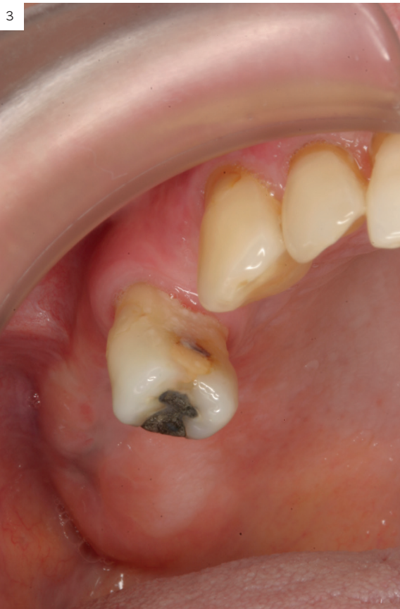
Figuras 3 y 4. Imágenes tras 7 días desde la infiltración de PRG-Endoret. Como podemos observar las lesiones se encuentran completamente resueltas y ahora podemos iniciar el tratamiento con implantes dentales.