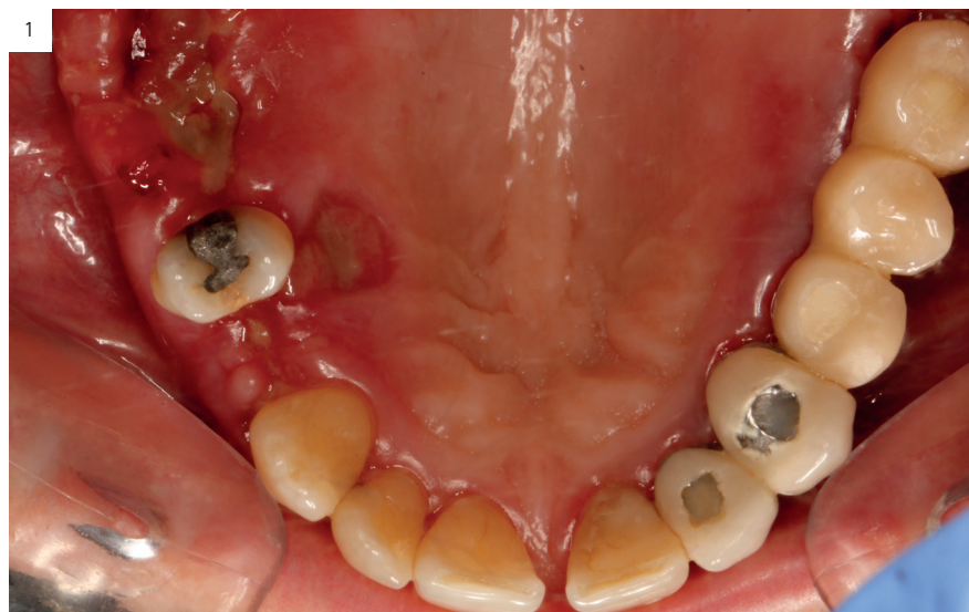
Figuras 1 y 2. Imágenes de la paciente una vez terminado el tratamiento con corticoides tópicos (2 ciclos) y con corticoides sistémicos. En este momento se decide suspender el tratamiento convencional y realizar una infiltración con PRGF-Endoret.

Presentamos el caso clínico de una mujer de 54 años diagnosticada con LPO de tipo erosivo que acude a la consulta para rehabilitarse con implantes dentales zonas edéntulas en el maxilar superior e inferior. El primer paso en este tipo de situaciones es la estabilización del cuadro, para poder comenzar la cirugía en las mejores condiciones posibles 28,29 . Para ello se realiza tratamiento de las lesiones erosivas hasta conseguir su completa resolución. En este caso, se utilizaron corticoides tópicos (acetónido de triamcinolona al 0,5%, en solución acuosa durante 30 días procediendo al ascenso de la concentración al doble durante un mes más) y sistémicos (prednisona 1 mg/kg/día durante un mes más) y tras no lograr el cese de las lesiones ulcerosas se procede a realizar una infiltración con PRGF-Endoret de las áreas que aún permanecen erosivas, según el protocolo publicado por nuestro grupo de estudio 30 . (Figuras 1-4).