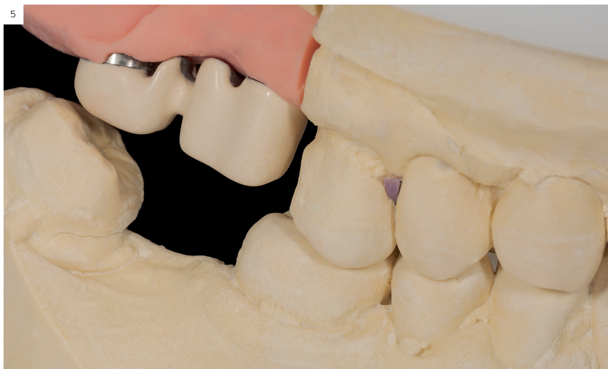
Figuras 5 y 6. Imágenes de la estructura metálica de titanio con el opaquer terminado y fotopolimerizado.

ra con \text{Al}_2\text{O}_3 de 90\ \mu . para lograr una correcta adherencia del opaquer. Después se aplica un primer para metales: Solidex Metal photo primer (Shofu dental GmbH, Ratingen, Alemania) y se fotopolimeriza durante 2 minutos (figuras 5 y 6).