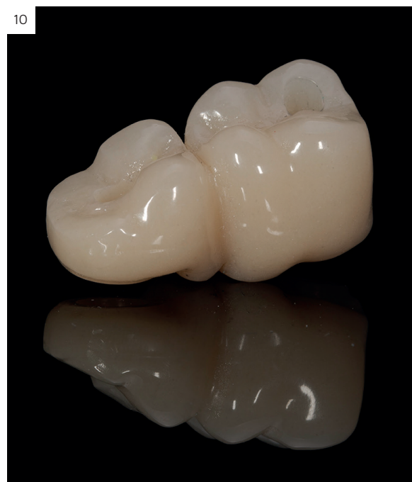
Figuras 9 y 10. Cerámica inyectada antes de su cementado en la estructura metálica.