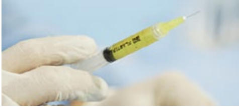
Líquido para la infiltración en la piel.

La versatilidad de la tecnología ENDORET permite adaptarla a diferentes usos clínicos. (8)