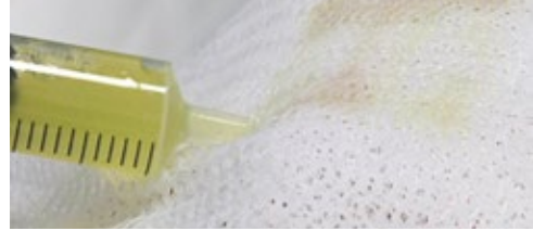
Líquido para su aplicación como mascarilla post-tratamiento.